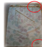
突っ張り棒を通す箇所はすそ上げテープで仕上げました。