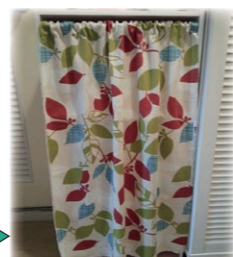
余っていた布地を突っ張り棒で目隠しカーテン。