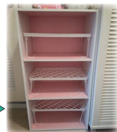
100円ショップの収納棚を各BOXに設置。