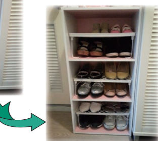
こうすることで靴もたくさん収納できます。