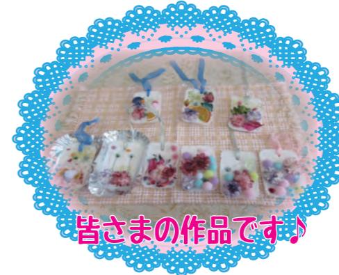
皆さまの作品です♪