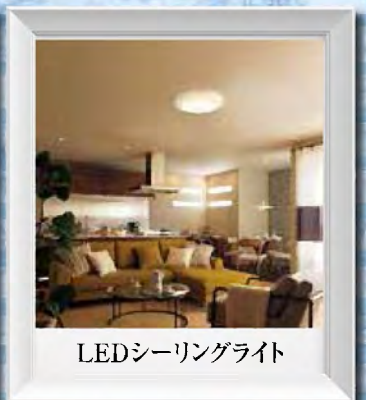
LEDシーリングライト