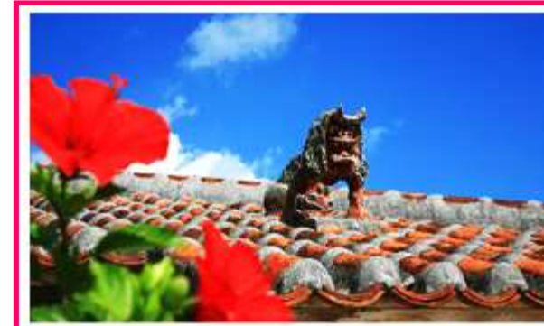
みんなでワイワイ。南国の旅へ