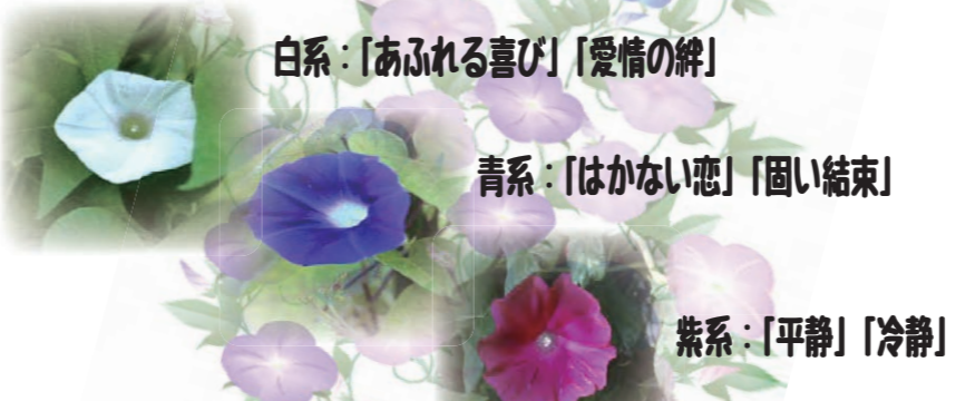
白系：「あふれる喜び」「愛情の絆」

朝顔は日本人にはなじみが深く夏を代表する花ですね。こどもの頃に育てた経験がある方、早朝に咲く朝顔を見るために早起した経験のある方も多いのではないのでしょうか。お花には花言葉がありますが朝顔は色ごとにそれぞれ花言葉があります。